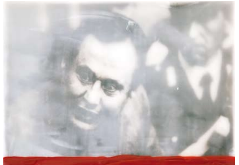
«Liggio Leggio», Encaustik auf Holz, 21 x 30 cm, 2006 (nach Photo Photoarchiv Sizilien)