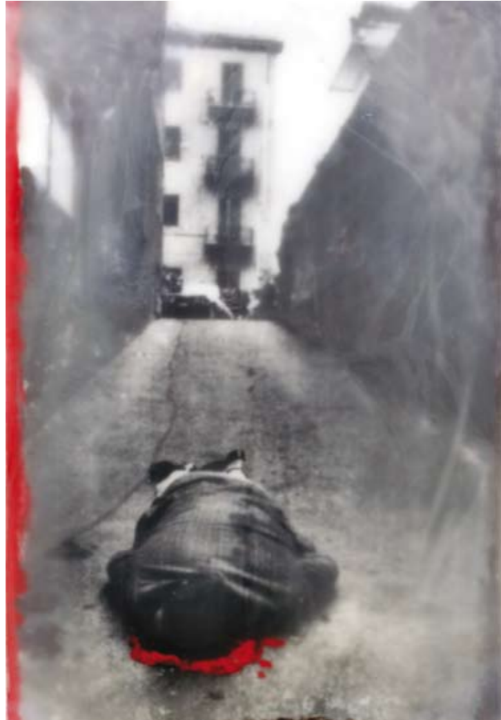
«Einsamer Tod», Encaustik auf Holz, 75 x 51 cm, 2006, (nach Photographie von LB)