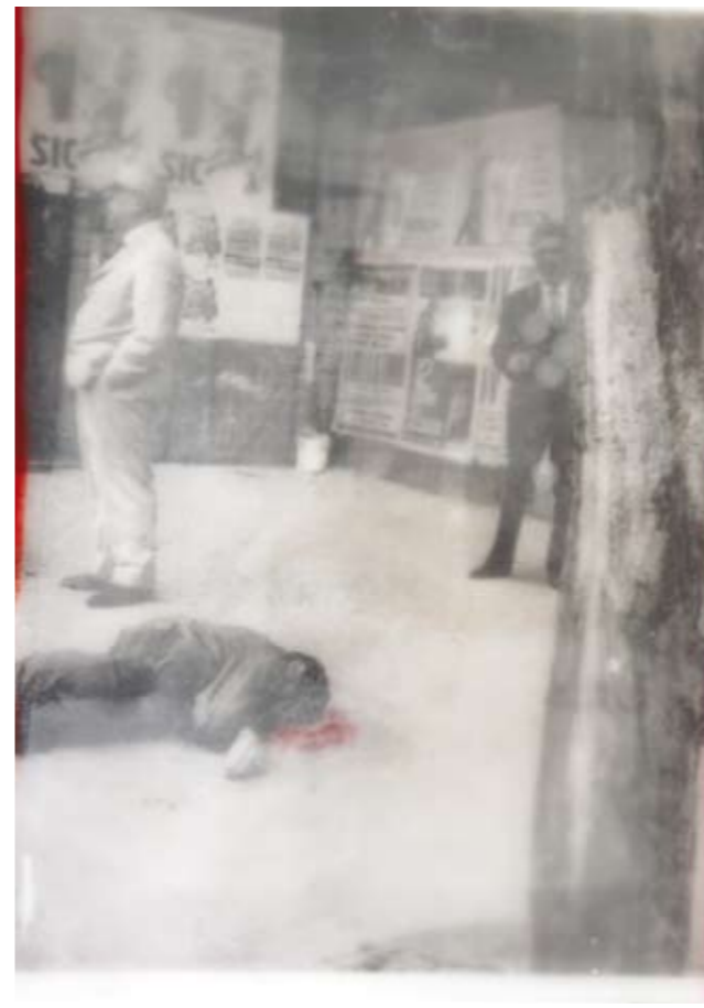
«Nu sacciu' cuié», Encaustik auf Holz, 30 x 21 cm, 2006 (nach Photo Photoarchiv Sizilien)