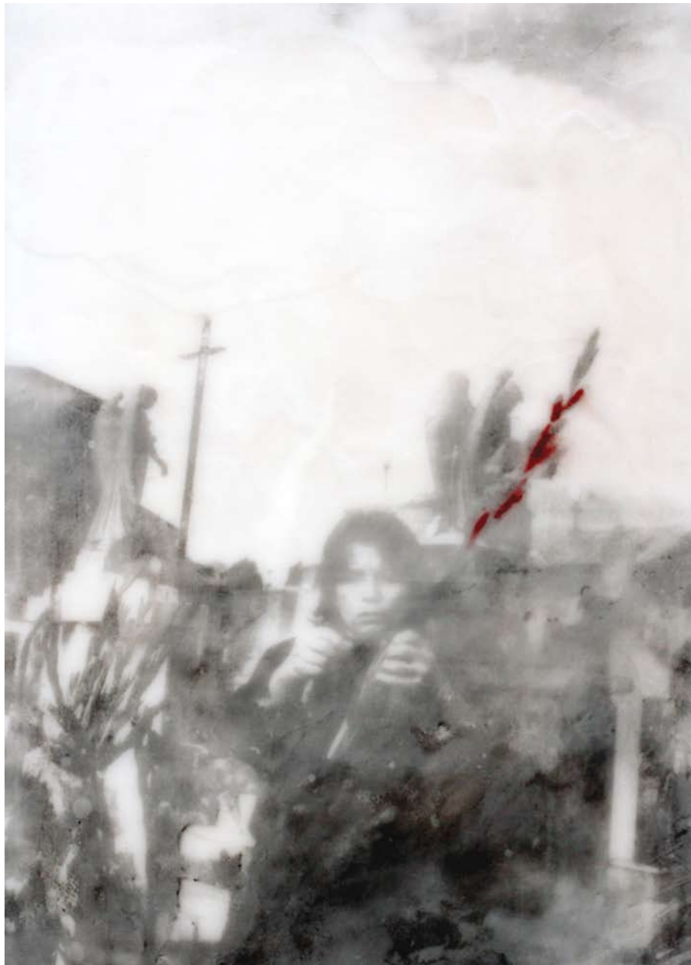
«Tag der Toten», Encaustik auf Holz, 99 x 64 cm, 2005, (nach Photographie von LB)