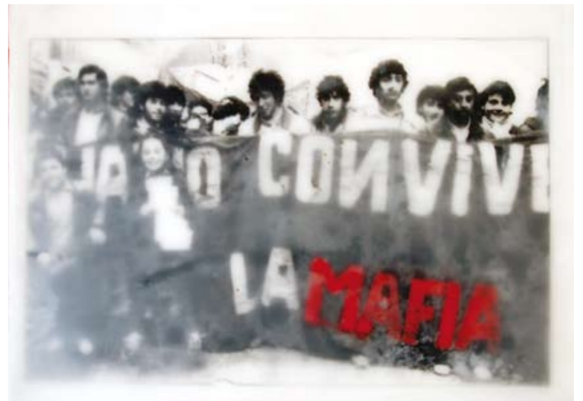
«Basta con la mafia», Encaustik auf Holz, 30 x 21 cm, 2006 (nach Photographie von LB)