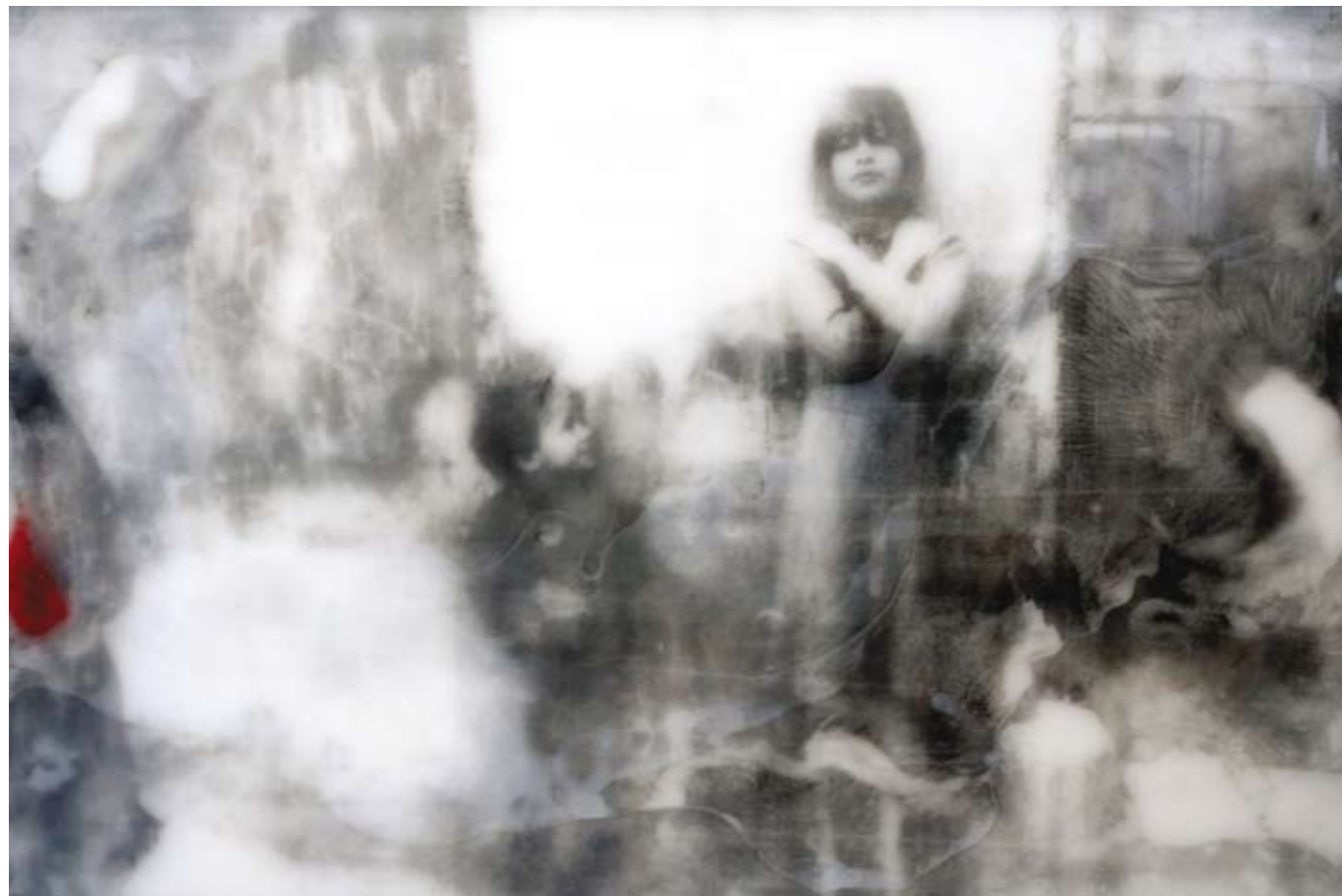
«Bambini di Palermo», Encaustik auf Holz, 66 x 100 cm, 2005, (nach Photographie von LB)