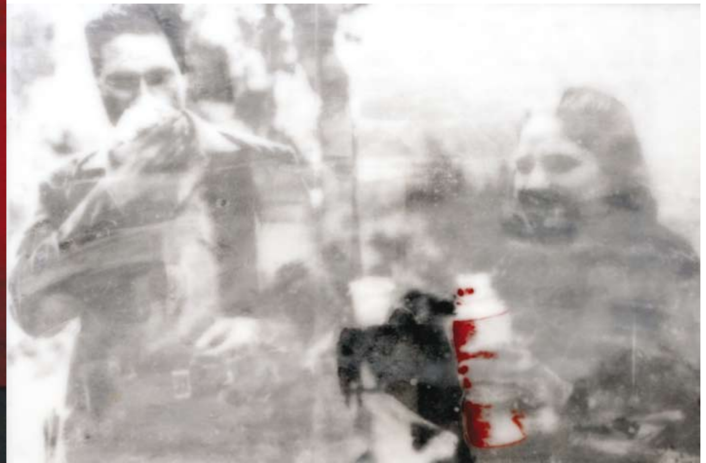
«Mutterstolz», Encaustik auf Holz, 66 x 99 cm, 2005, (nach Photographie Provinienz Sciortino)