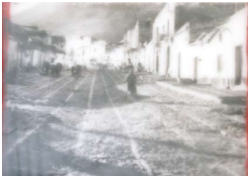
«Castellamare del Golfo», Encaustik auf Holz, 21 x 30 cm, 2006 (nach Photo Photoarchiv Sizilien)