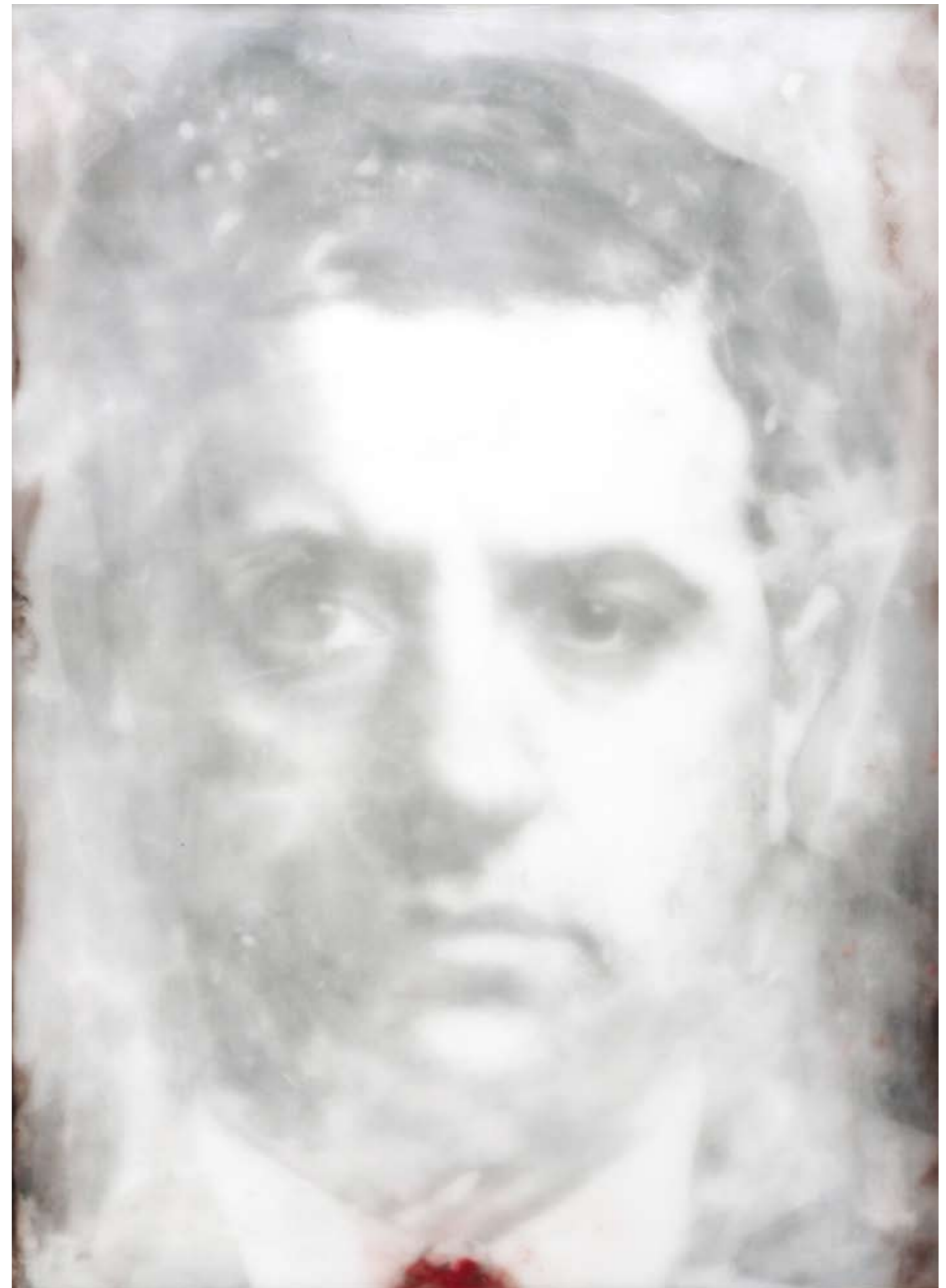
«Alberto Anastasia», Encaustik auf Holz, 90 x 76 cm, 2005, (nach Portraitaufnahme)

Dreidimensional ist auch ein Objekt, das die eigentümliche «Beziehung» zwischen Cosa Nostra und Religiosität aufgreift. Diese Religiosität wurde immer wieder beigezogen, um alles durch eine rosarote Brille zu sehen. So verstiegen sich Aussenstehende sogar zur Vermutung, die Cosa Nostra sei einfach «eine sizilianische Ausprägung der katholischen Kirche». Und Innenstehenden bot die Religion die wunderbare Chance, jegliche Schuld selbst vor sich selbst zu leugnen (wir erinnern uns: «Gott weiss, dass sie selbst getötet werden wollen und ich daran keine Schuld habe»). – Künstlerisch verdichtet, erhebt sich die Madonna über einer grossen Patrone.