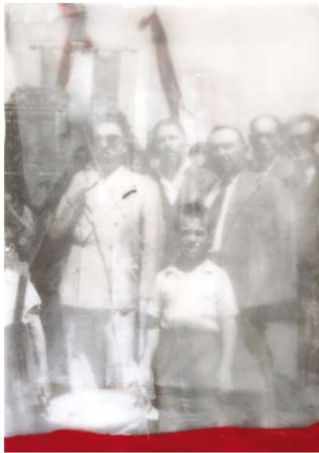
«Funerale di don Calogero Vizzini», Encaustik auf Holz, 30 x 21 cm, 2006 (nach Photo Photoarchiv Sizilien)