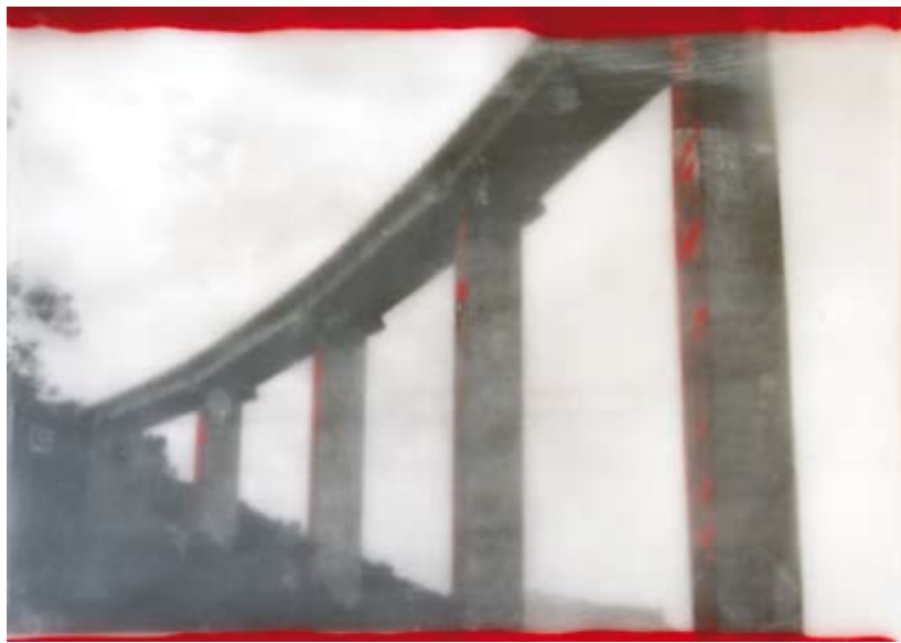
«Lupara bianca», Encaustik auf Holz, 21 x 30 cm, 2006 (nach Photographie von Patrick Lo Giudice)