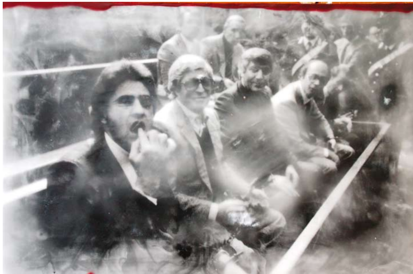
«Processo Spatola» Dove é la mafia?, Encaustik auf Holz, 44 x 67 cm, 2006, (nach Photographie von FZ)