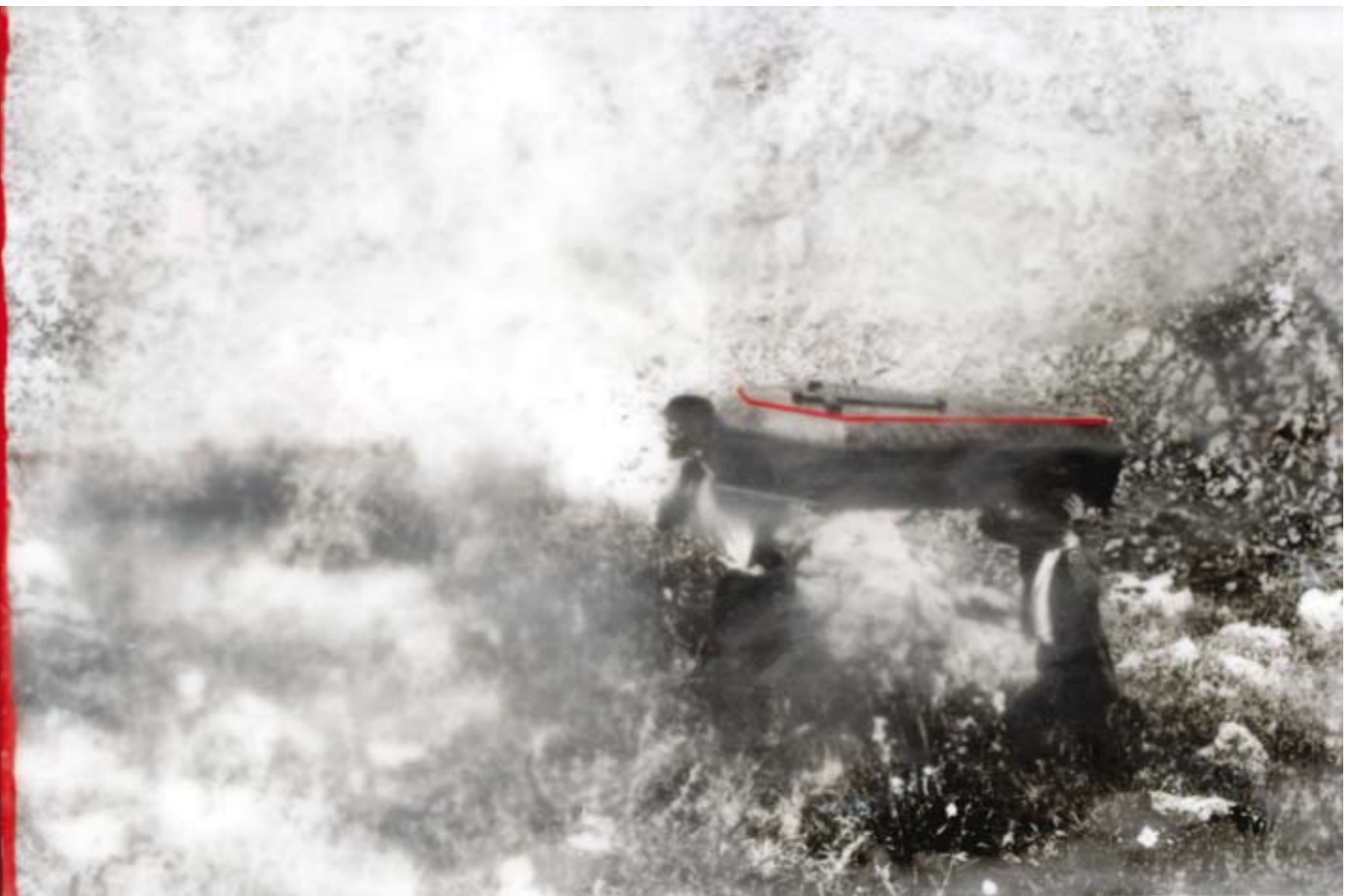
«Die Sargträger» (Version II), Encaustik auf Holz, 88 x 56 cm, 2006, (nach Photo Photoarchiv Sizilien)