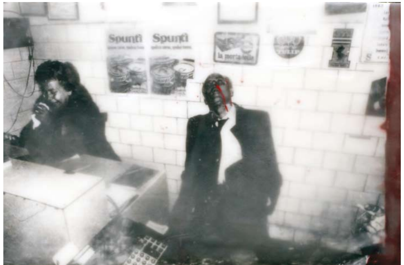
«Er wollte sich nur ausruhen», Encaustik auf Holz, 60 x 100 cm, 2006, (nach Photographie von FZ)