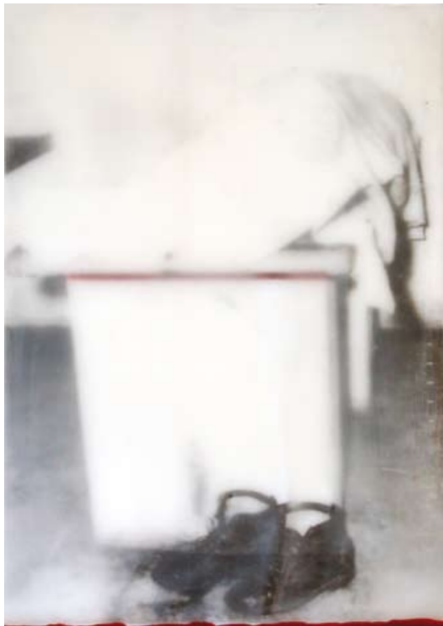
«Obitorio», Encaustik auf Holz, 30 x 21 cm, 2006 (nach Photo Photoarchiv Sizilien)