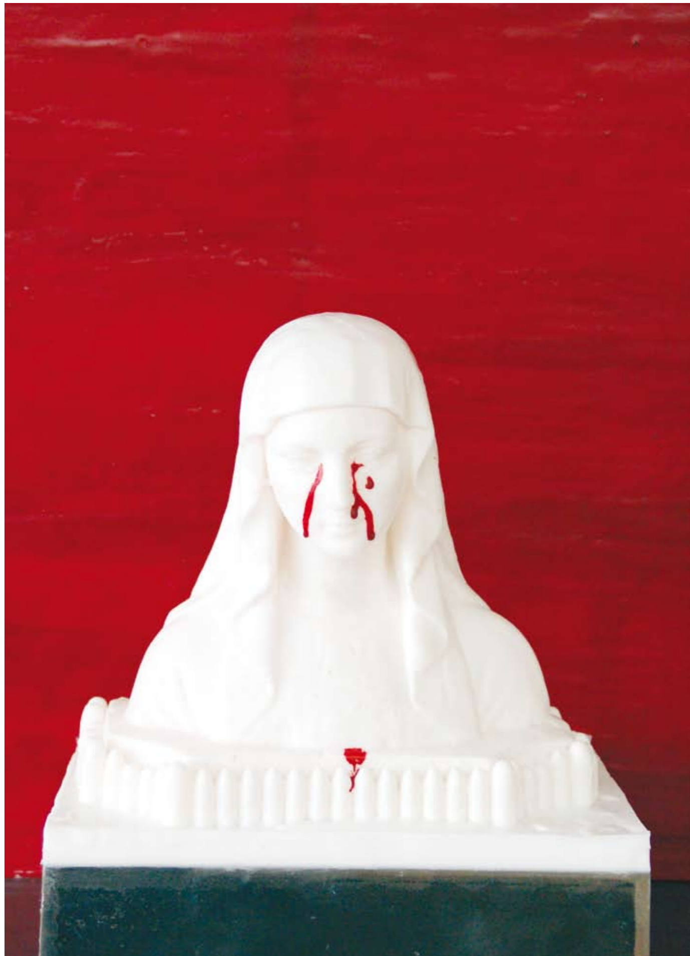
«Madonna delle lacrime», Encaustik, 70 x 50 x 20 cm, 2006