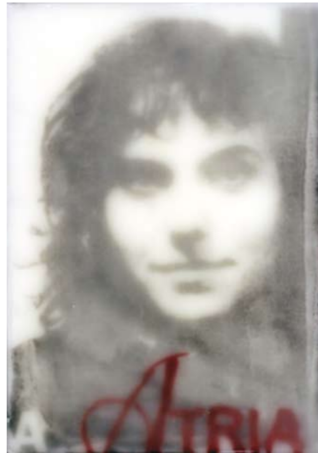
«Grazie Rita», Encaustik auf Holz, 30 x 21 cm, 2006