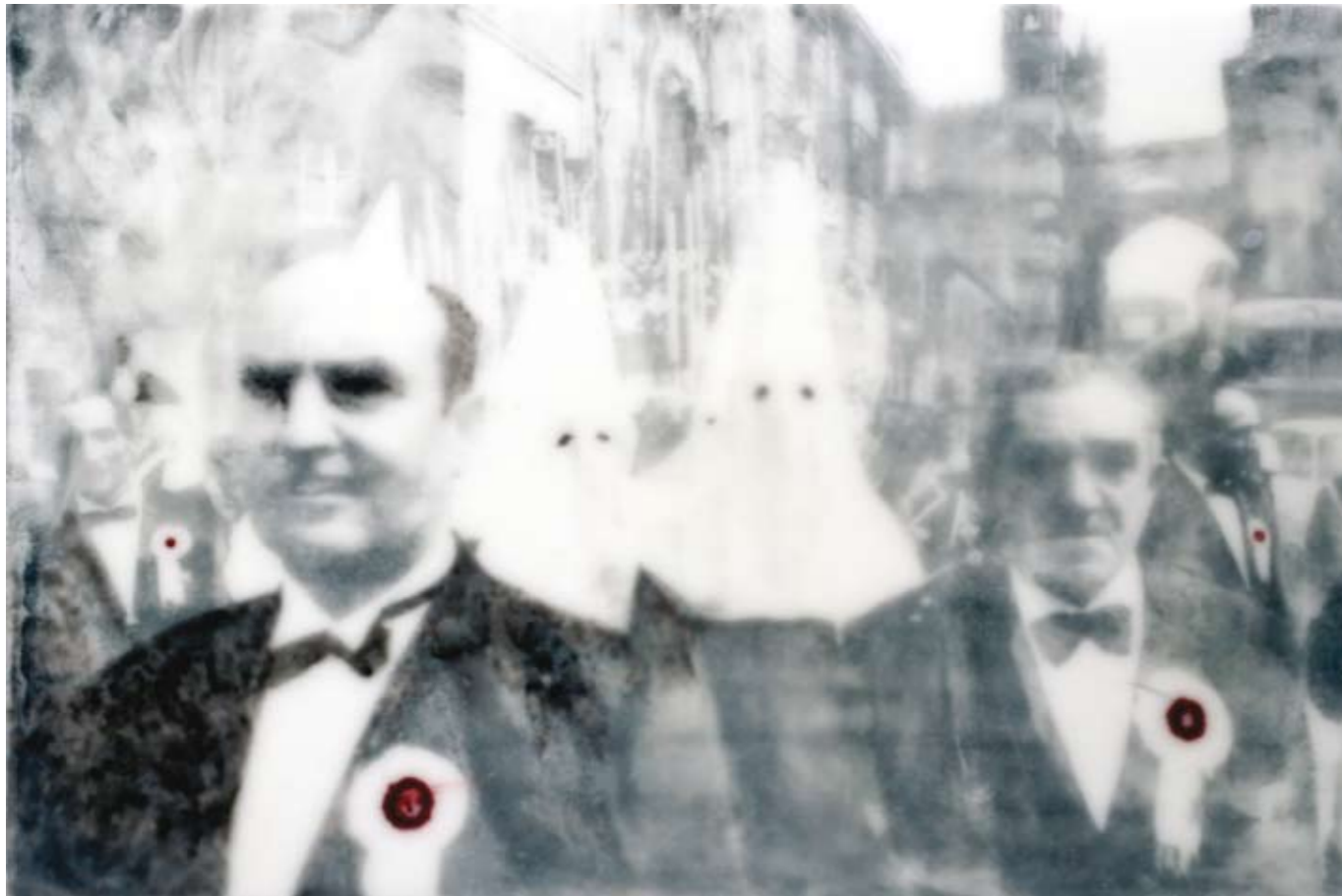
«Venerdì Santo a Palermo», Encaustik auf Holz, 56 x 88 cm, 2005, (nach Photographie von FG)