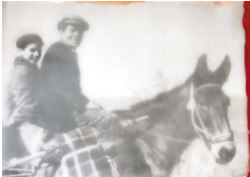
«Padre figgiù mulo», Encaustik auf Holz, 21 x 30 cm, 2006