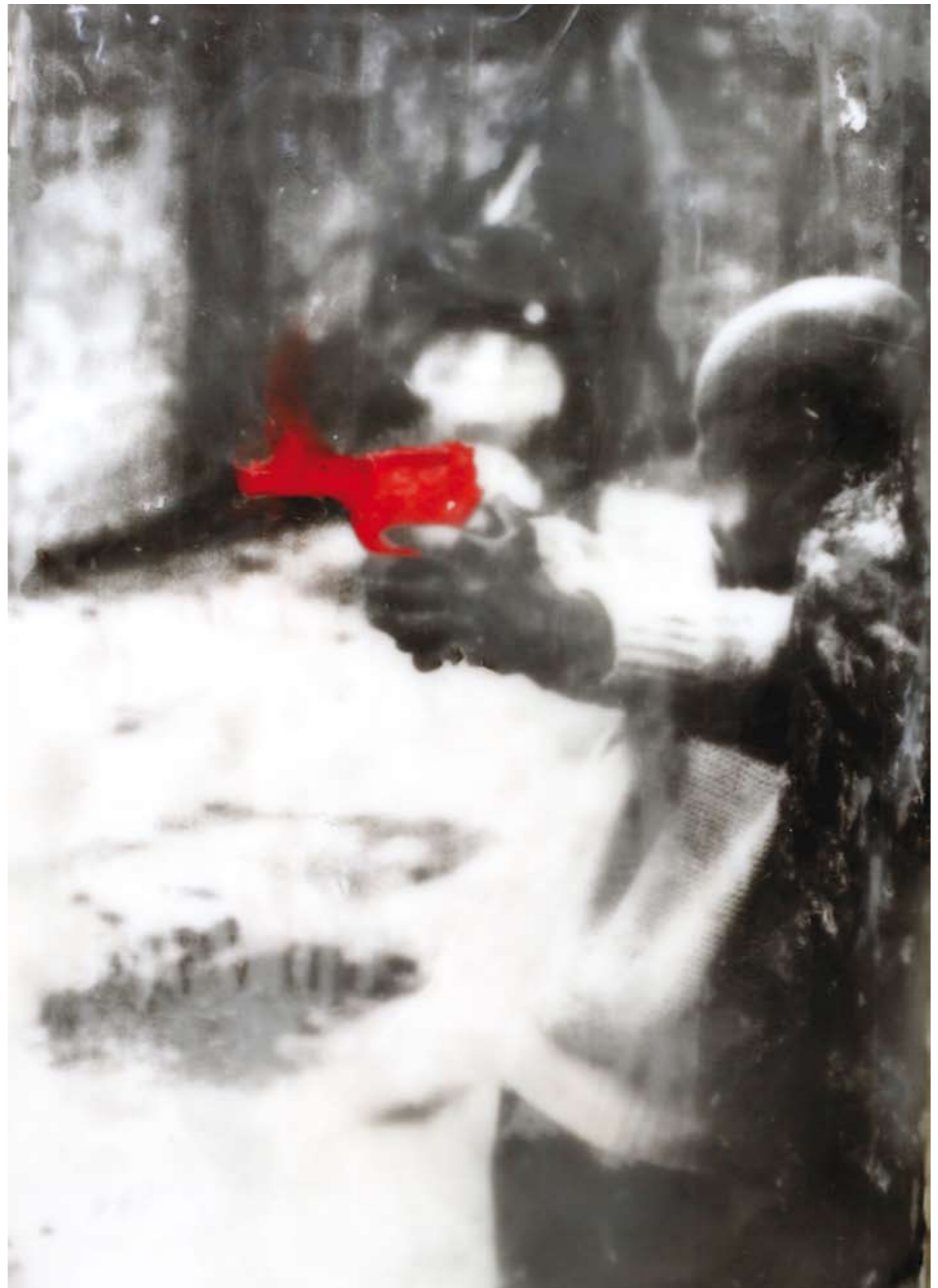
«Il gioco del killer», Encaustik auf Holz, 88 x 59 cm, 2006, (nach Photographie von LB)