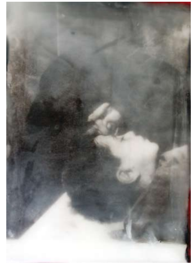
«U niputeddu mazzato», Encaustik auf Holz, 30 x 21 cm, 2006 (nach Photo Photoarchiv Sizilien)