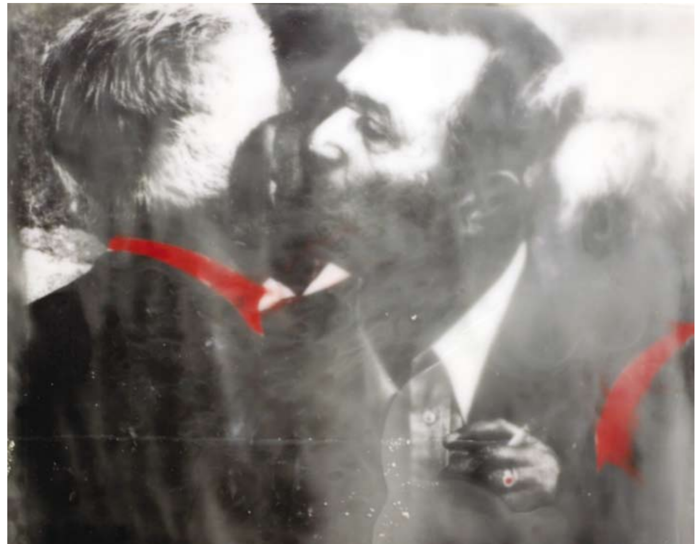
«Il Bacio», Encaustik auf Holz, 47 x 59 cm, 2006