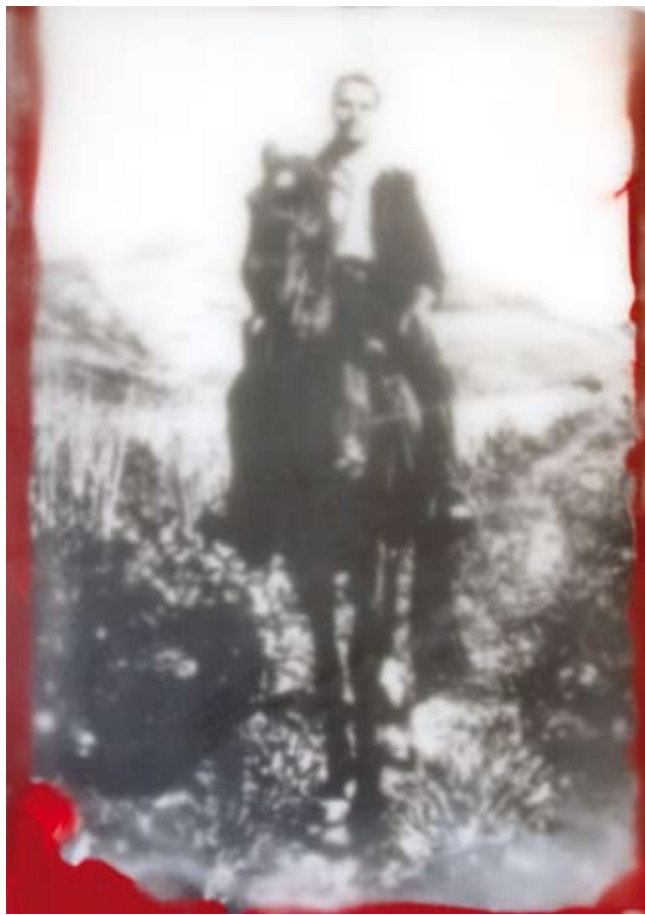
«Il comandante Giuliano», Encaustik auf Holz, 30 x 21 cm, 2006 (nach Photographie Provinienz Sciortino)