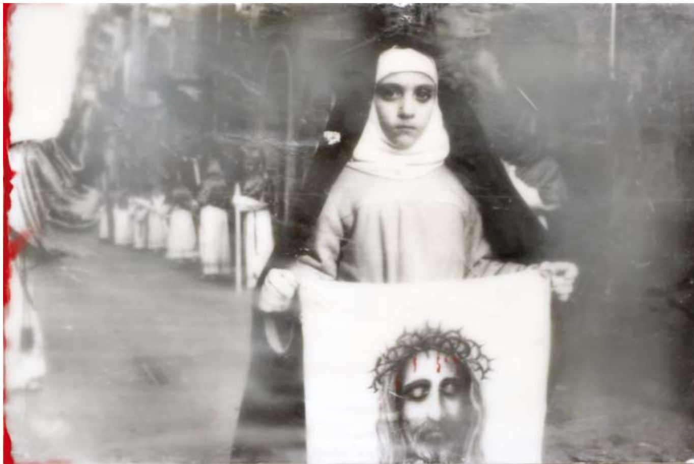
«Processione dei Misteri a Trapani», Encaustik auf Holz, 56 x 88 cm, 2005, (nach Photographie von FG)