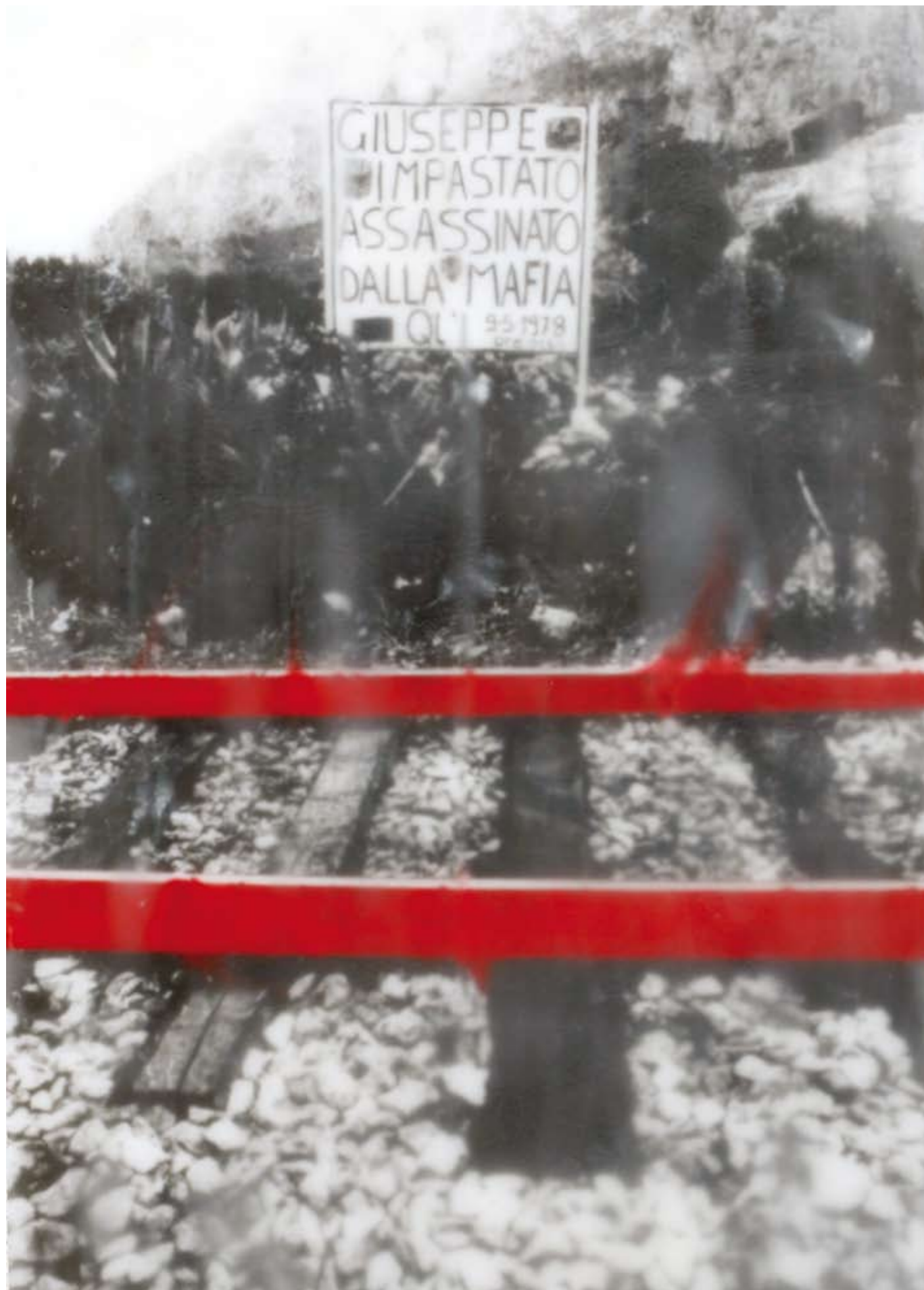
«Giuseppe Impastato», Encaustik auf Holz, 88 x 59 cm, 2006, (nach Photographie von FZ)