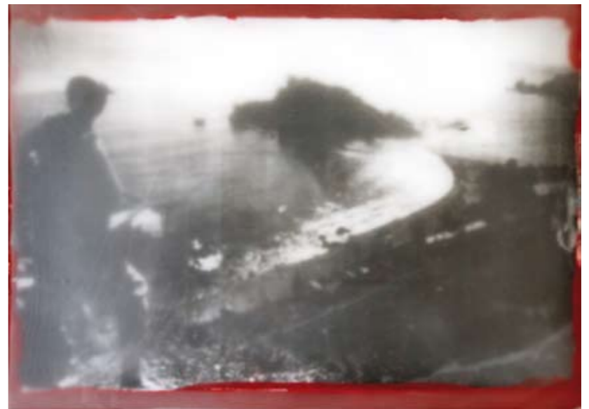
«Taormina», Encaustik auf Holz, 21 x 30 cm, 2006 (nach Photo Photoarchiv Sizilien)