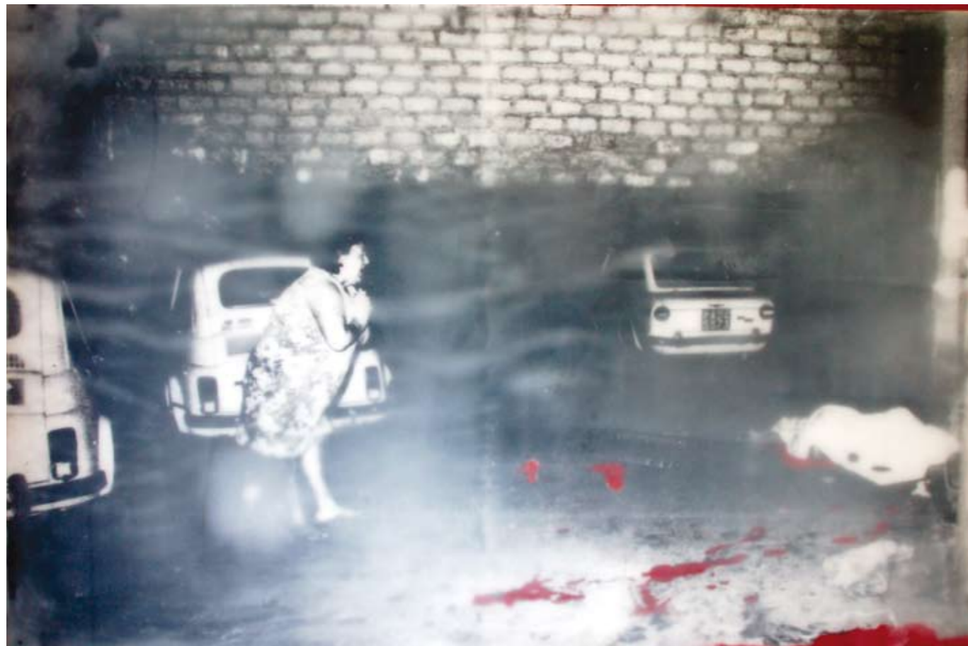
«Cannoli», Encaustik auf Holz, 57 x 86 cm, 2006, (nach Photographie von LB)