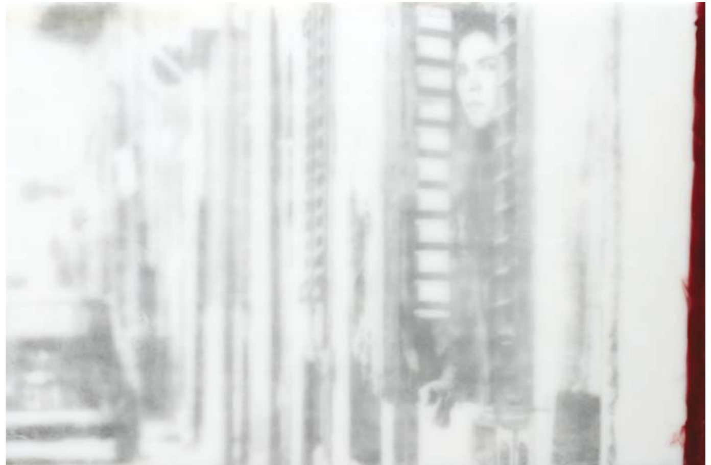
«Diffidenza», Encaustik auf Holz, 56 x 88 cm, 2005, (nach Photographie von FG)