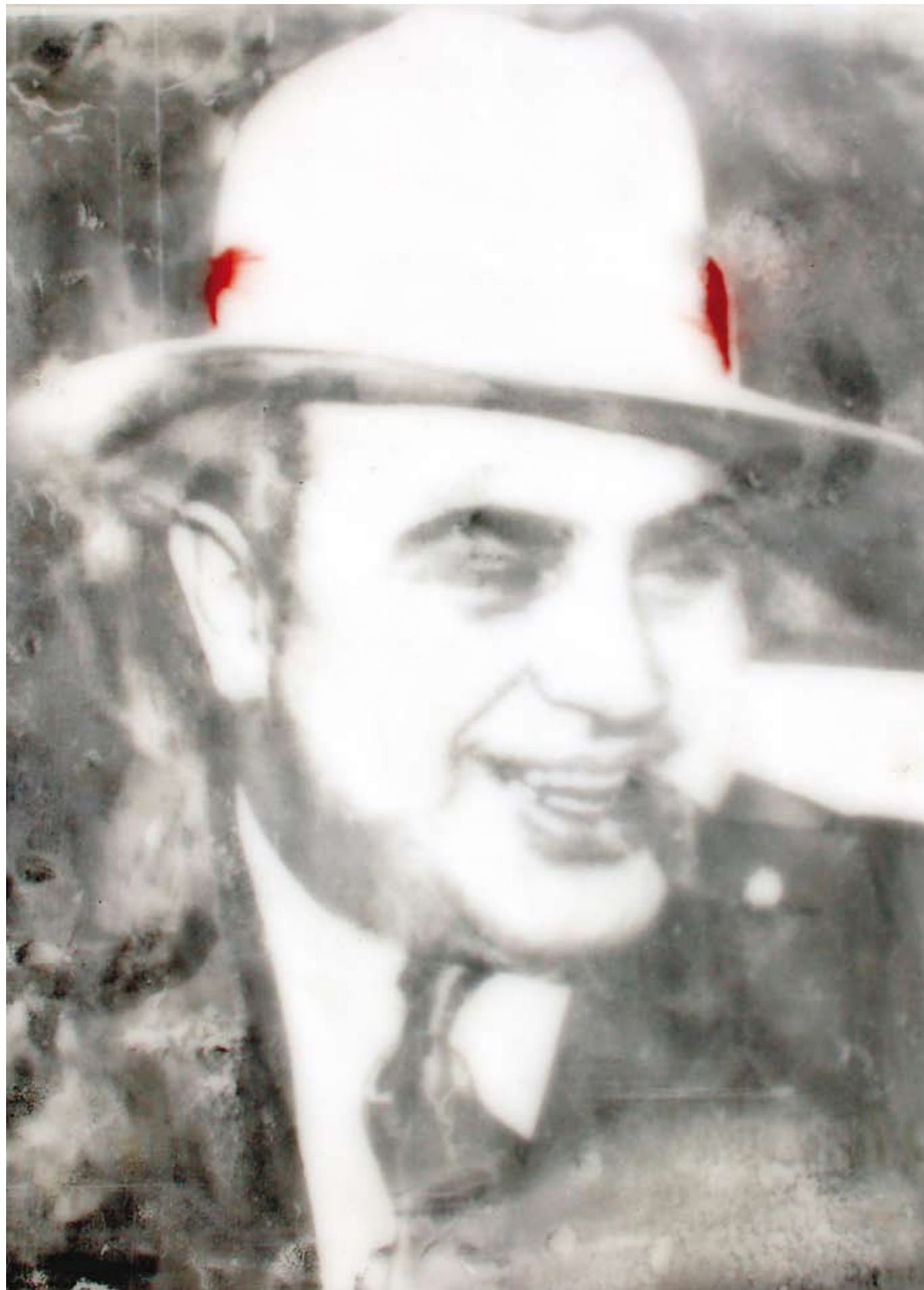
«Al Capone», Encaustik auf Holz, 77 x 90 cm, 2006, (nach Portraitaufnahme)