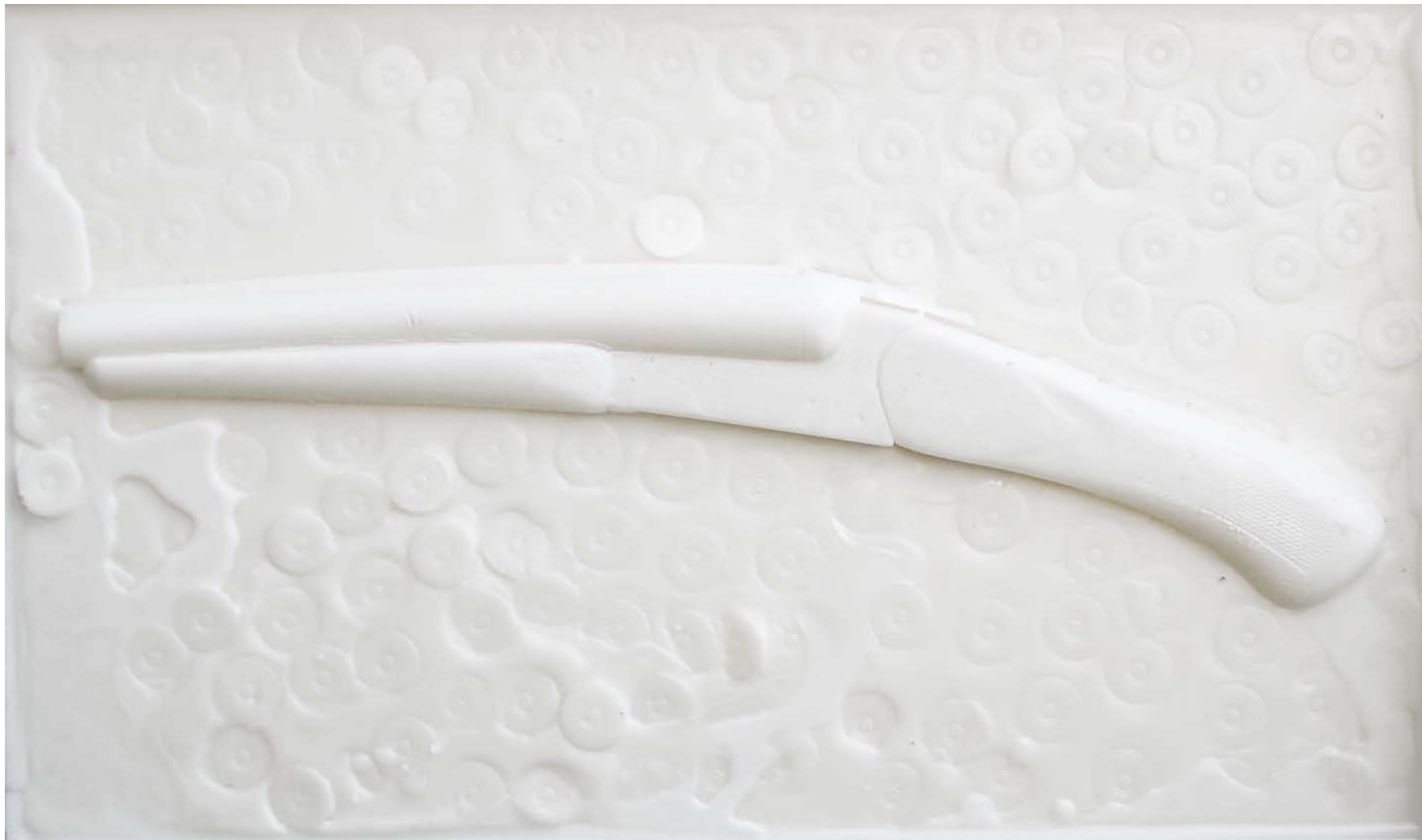
«Lupara bianca», Encaustik auf Holz, 28 x 47 cm, 2006