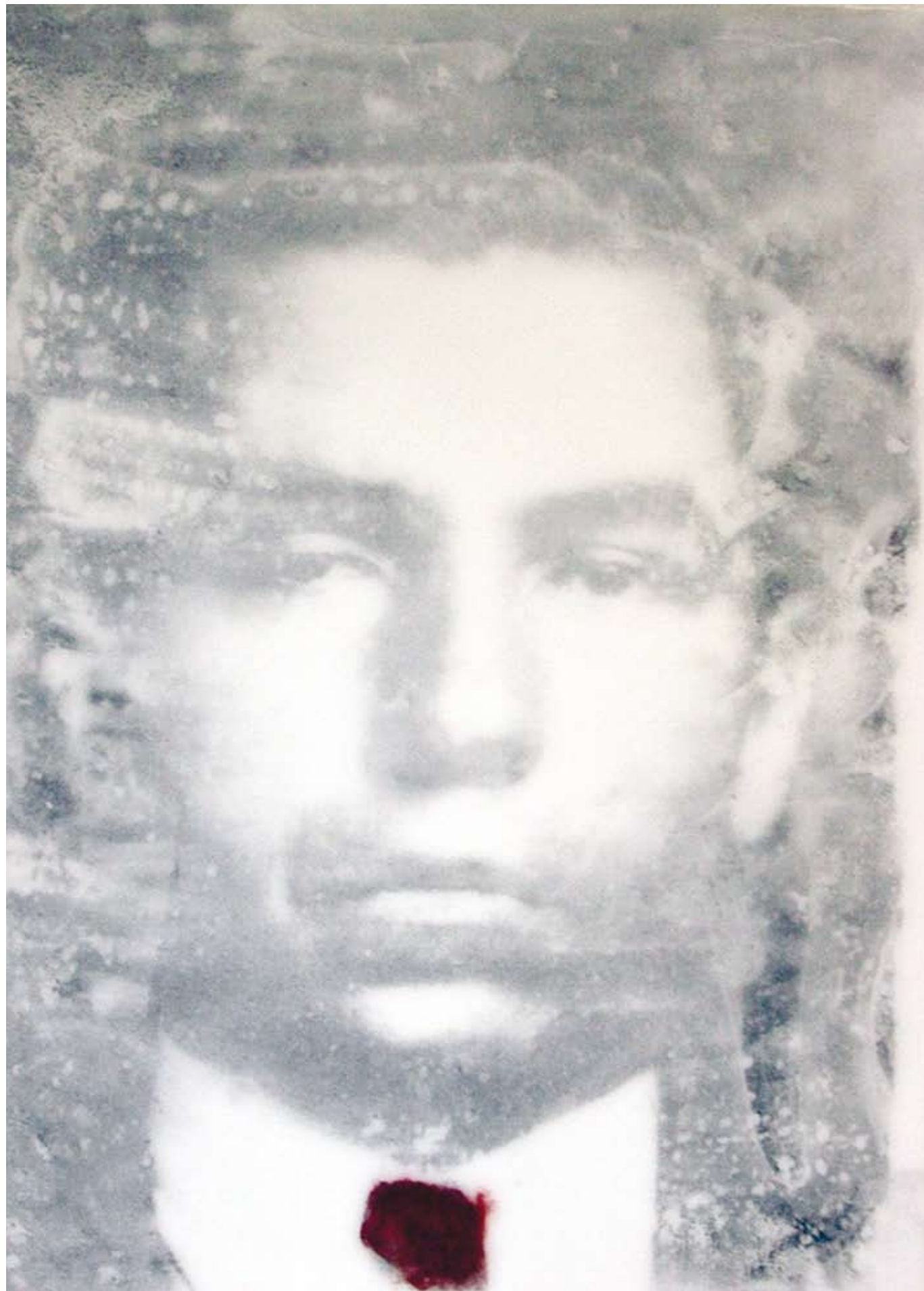
«Lucky Luciano», Encaustik auf Holz, 88 x 70 cm, 2006, (nach Portaitaufnahme 30er Jahre)