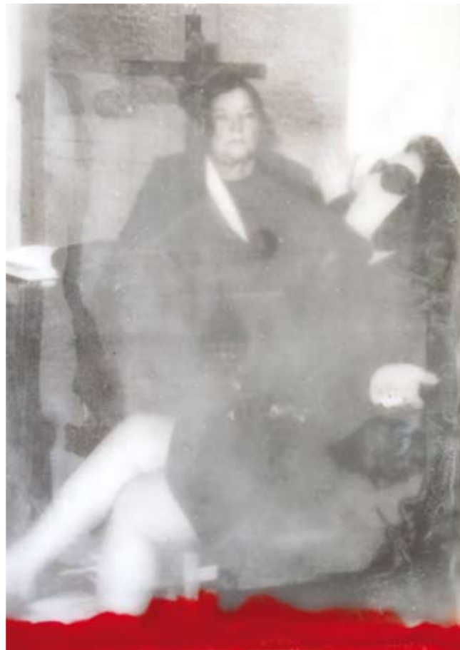
«Non sacciu'nde», Encaustik auf Holz, 30 x 21 cm, 2006