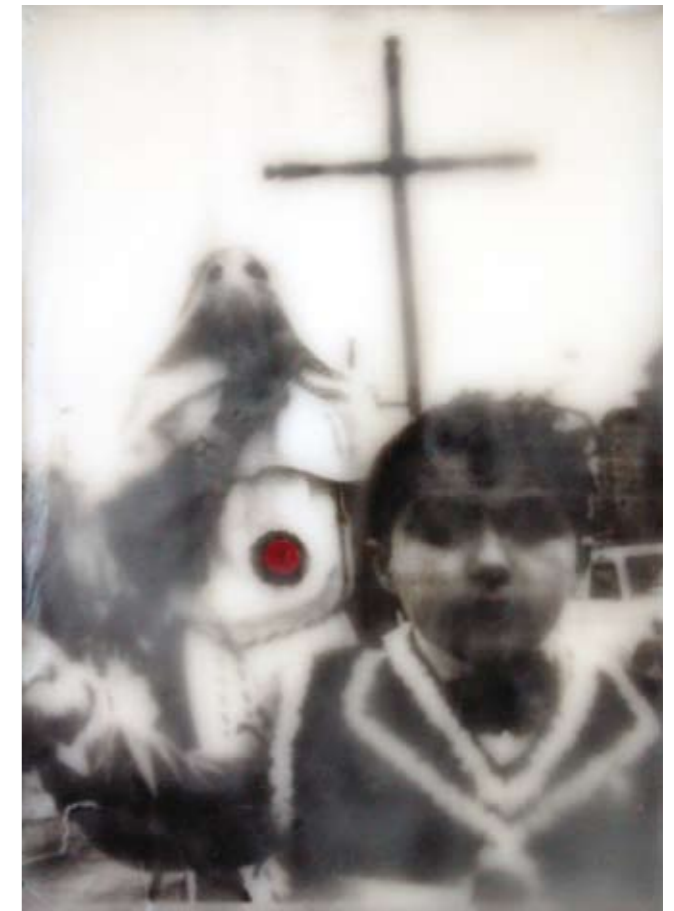
«Processione», Encaustik auf Holz, 30 x 21 cm, 2006