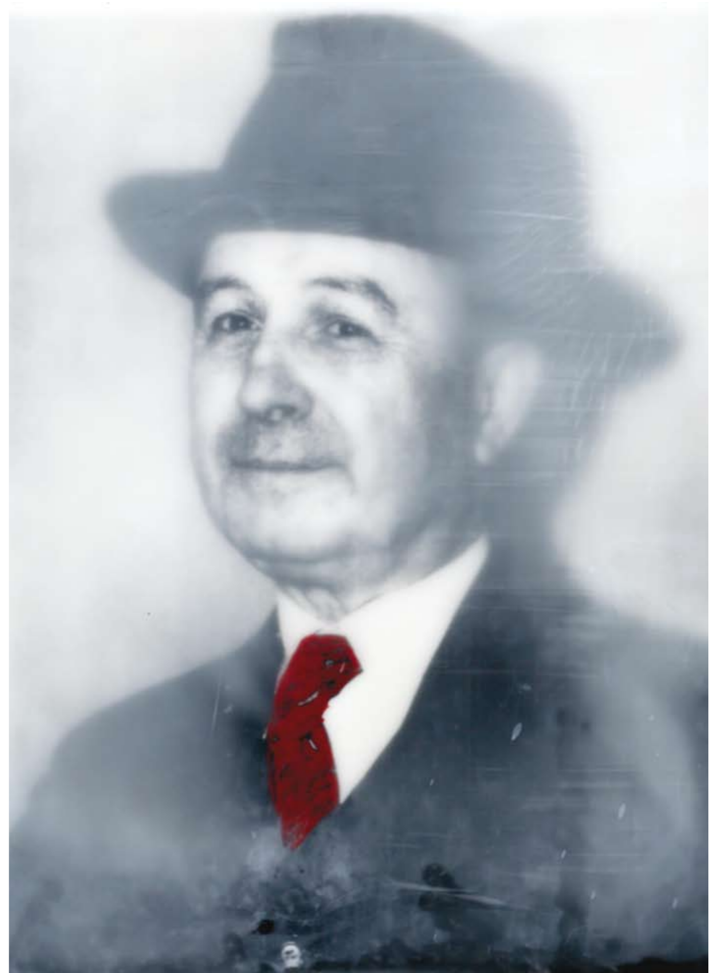
«Johnny Torrio», Encaustik auf Holz, 76 x 61 cm, 2006, (nach Portraitaufnahme 30er Jahre)